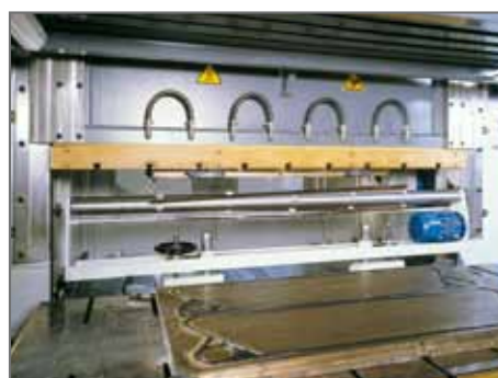
Stampaggio guarnizioni a compressione

RM Service fornisce anche guarnizioni per valvole a farfalla e raccorderia a norme DIN - ISO - CLAMP - S.M.S. BS - IDF per l'industria.