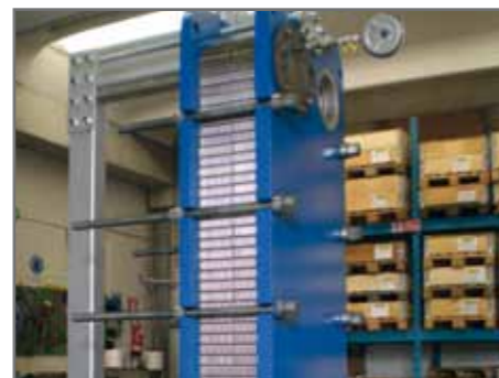
Prova di tenuta su scambiatore rigenerato