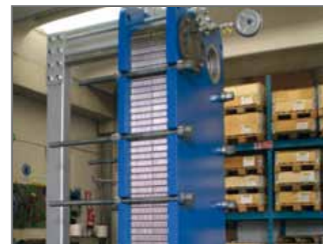
Prova di tenuta su scambiatore rigenerato