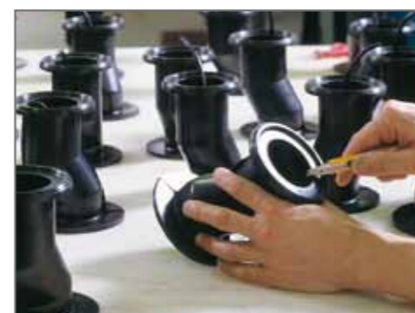
Alcune delle fasi di sbavatura delle guarnizioni