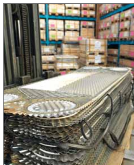
1. Ricevimento e ispezione delle piastre

Lavorazione accurata, ricambi originali e certificati dai produttori