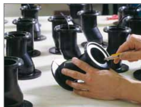
Alcune delle fasi di sbavatura delle guarnizioni