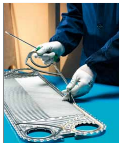
2. Rimozione delle vecchie guarnizioni