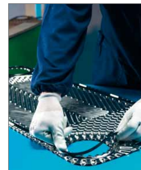
9. Montaggio guarnizioni esenti da colla