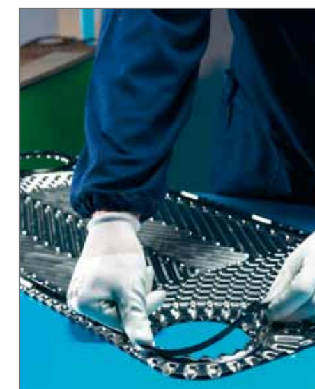
9. Montaggio guarnizioni esenti da colla