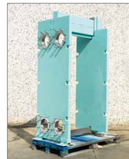
8. Telaio sabbato e verniciato