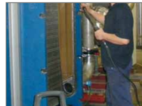
Pulizia in loco del pacco piastre