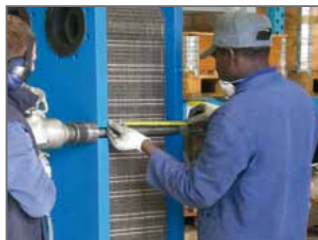
Smontaggio e verifica