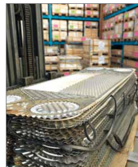
1. Ricevimento e ispezione delle piastre