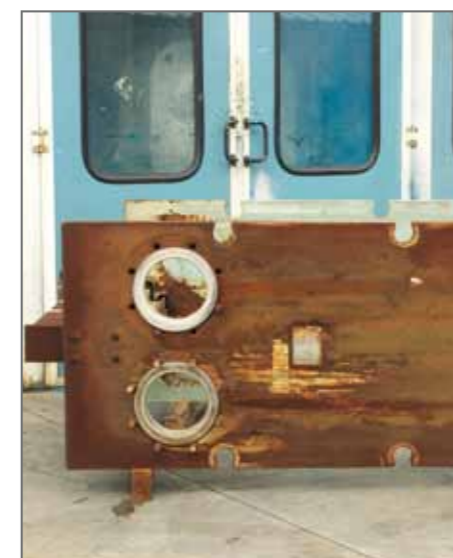
7. Particolare telaio da sottoporre a sabbatura e verniciatura