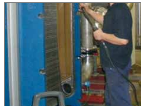
Pulizia in loco del pacco piastre