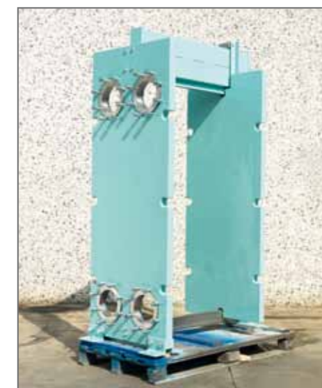
8. Telaio sabbato e verniciato