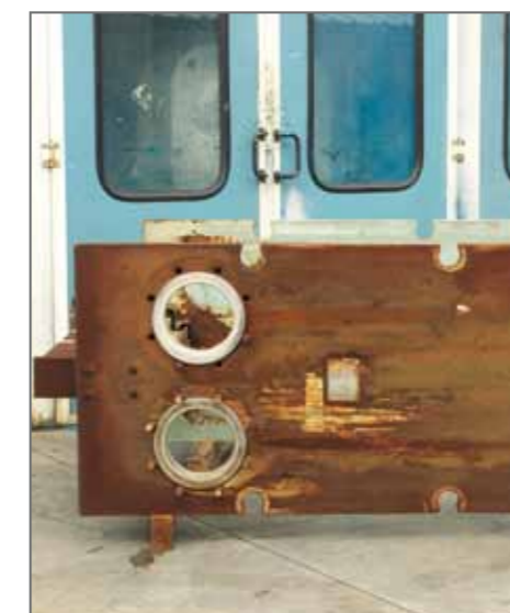
7. Particolare telaio da sottoporre a sabbatura e verniciatura