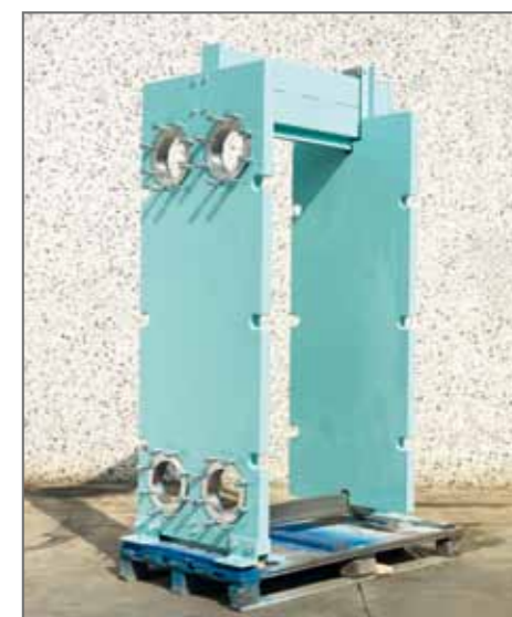
8. Telaio sabbato e verniciato