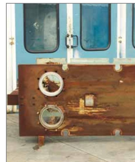
7. Particolare telaio da sottoporre a sabbatura e verniciatura