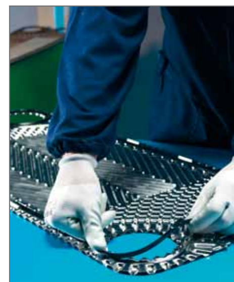
9. Montaggio guarnizioni esenti da colla