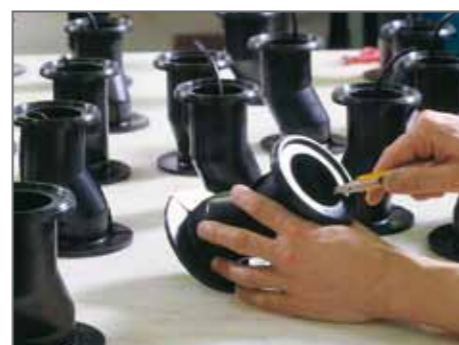
Alcune delle fasi di sbavatura delle guarnizioni