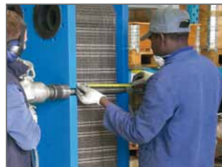
Smontaggio e verifica