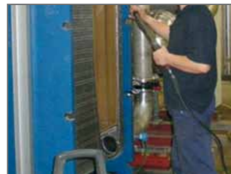
Pulizia in loco del pacco piastre