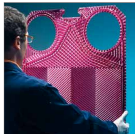
6. Pulizia piastre da liquidi di controllo